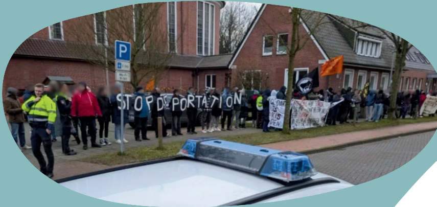
Die Unterstützer*innen der Betroffenen demonstrieren vor der Ausländerbehörde des Landkreises Leer.

Der Verein Afrikanische Diaspora Ostfriesland und der Flüchtlingsrat Niedersachsen e. V. sind empört über das Vorgehen der Ausländerbehörde und protestieren gegen die gewalttätige Abschiebungspraxis, die offenbar vom Innenministerium gedeckt wird.